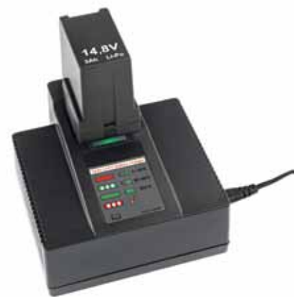
Ladegerät inkl. Akku für das TA 220 und TA 411

Um besonders den Aufgaben im hohen Spannungsbereich gerecht zu werden, wurde dieses Gerät entwickelt. Mit einer Spannkraft von 4.000 N wird dies eindrucksvoll unterstrichen.